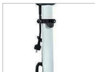
WYGODNE MIEJSCE NA PRZEWÓD