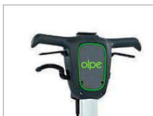
KOMFORTOWY SYSTEM OBSŁUGI