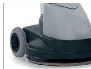
DUŻE KOŁA Z OPONAMI